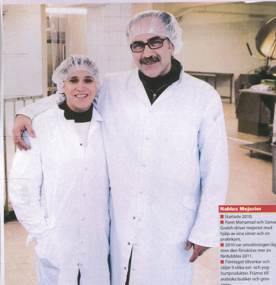
i centrala Malmö där de tillverkar palestinsk ost och yoghurtbullar.